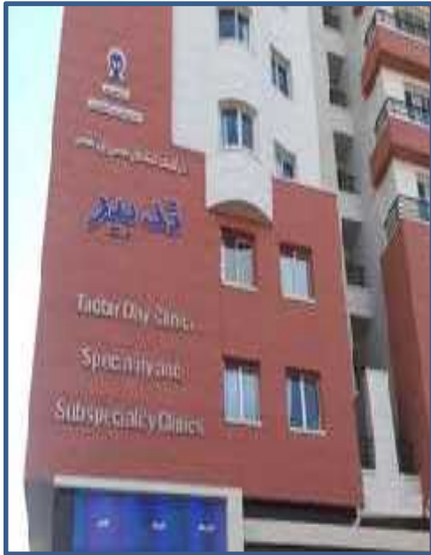
تهیه کننده: صغری پاهنگ

منبع: پرستاری داخلی جراحی برونر و سودارث